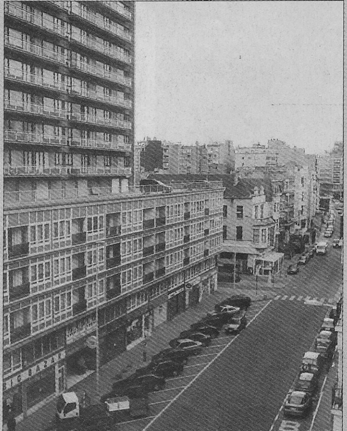
Moest Ensor vandaag nog leven, dan zou hij dit zien uit zijn