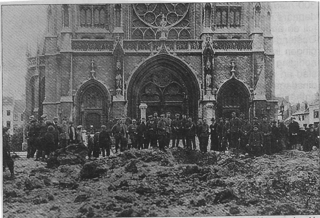
Een beeld uit juli 1917 : burgers en Duitse soldaten bekijken het vernielde parkje na een beschieting.