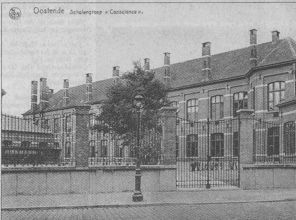
De Conscience school, gezien van in de Stuiverstraat.

De oudste leerling die er ooit was ingeschreven, was een 44-jarige kleinhandelaar uit de Rabotstraat. Ouderen uit het Westerkwartier noemen deze straat ook de Schaafstraat.