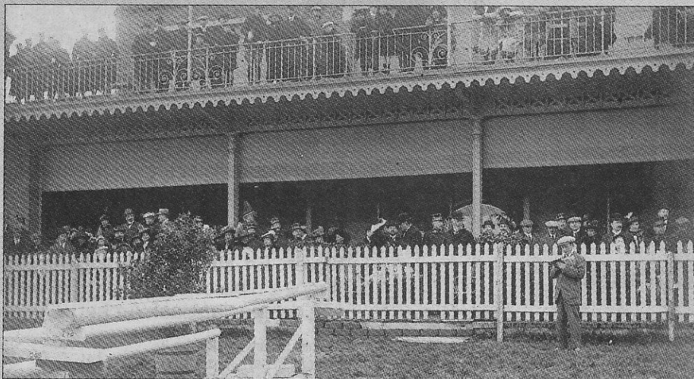
Een jumpingwedstrijd met Pasen 1913 nabij de duivenschietsing.

De duivenschietsing is een uitstekende leerschool voor koelbloedigheid en behendigheid. Feit is dat het duivenschietsen als sport verboden is en dat het mooie gebouw van de duivenschietsing jarenlang verwaarloosd werd. Hopelijk komt daaraan in de nabije toekomst verandering.