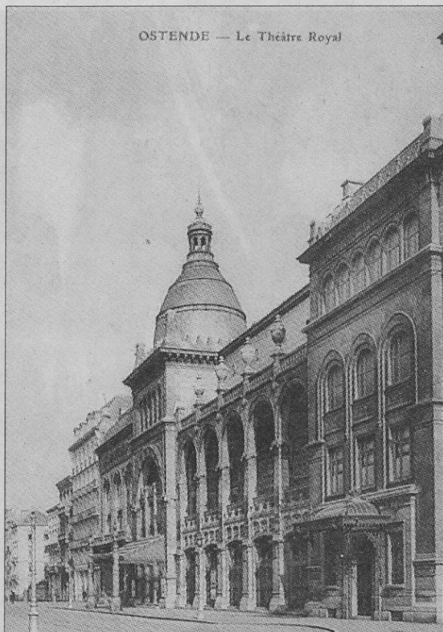
Het theater met de vier vazen.