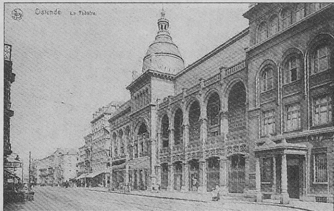
De schouwburg zonder de vier gevelbeelden.

schouwburg sierden. Ze stonden op een kunstige kolom ter ondersteuning van de glazen luifel. De bezetter hechtte er in '14-'18 blijkbaar waarde aan het brons en haalde de beelden weg. Ze werden nooit meer vervangen, zodat de marmeren zuilen er op het voetpad eerder kaal bijstonden tot en met de afbraak van het theater in 1965.