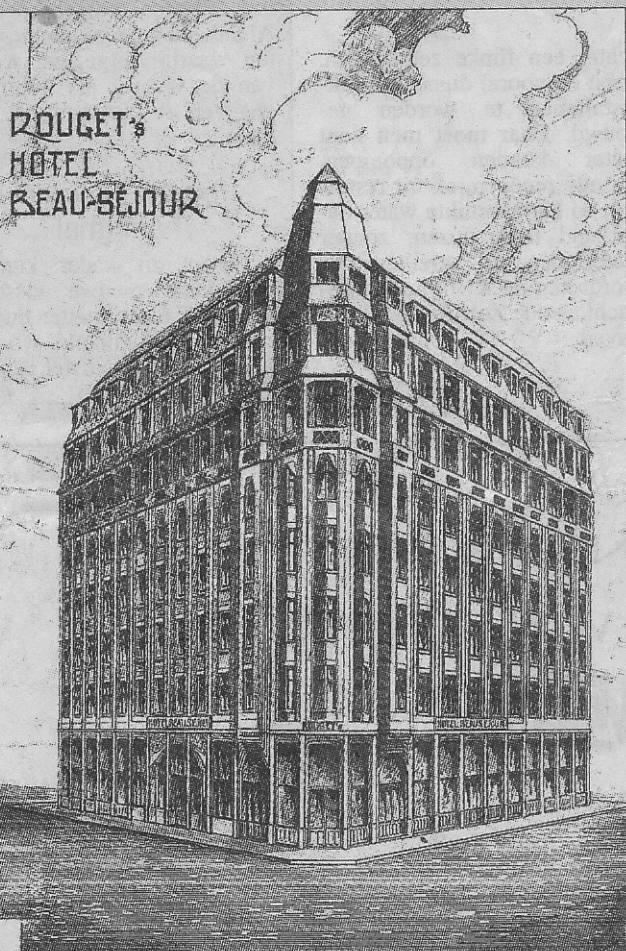
Hôtel Beau Séjour aan de Van Iseghemlaan.