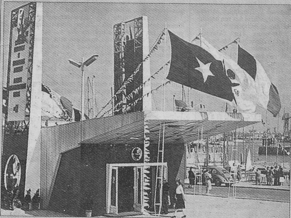
Het propagandapaviljoen van de wereldtentoonstelling Brussel '58 dat op de dijk nabij het Klein Strand in Oostende stond opgesteld.

Veertig jaar na de tentoonstelling van '58, die alle volkeren van de wereld in vrede en verdraagzaamheid dichterbij elkander moest brengen, kwam er van die edele gedacht weinig terecht. De eenwording van West-Europa uitgezonderd.