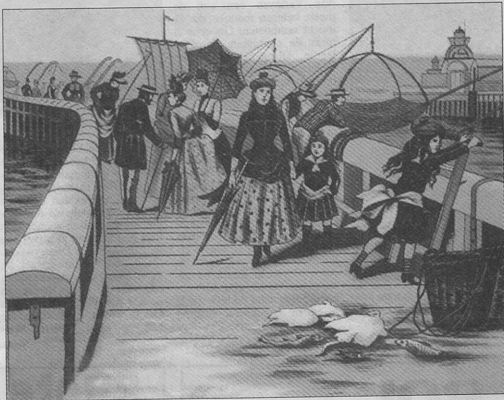
Een courant tijdsverdrif in Oostende was het vissen met kruisnetten vanop het staketsel (ca. 1870)

Een zeebad, waarbij men met een badkar tot aan het 'groot' strand werd gebracht kostte 1 fr, daarin was het gebruik van de kar inbegrepen. Wie aan het klein strand ging baden, diende slechts 0,8 fr. te dokken. Hierbij mocht maximaal 40 minuten worden gebaad. Voorts was het verboden om badkarren te verhuren aan mensen die niet van plan waren om in zee te zwemmen.