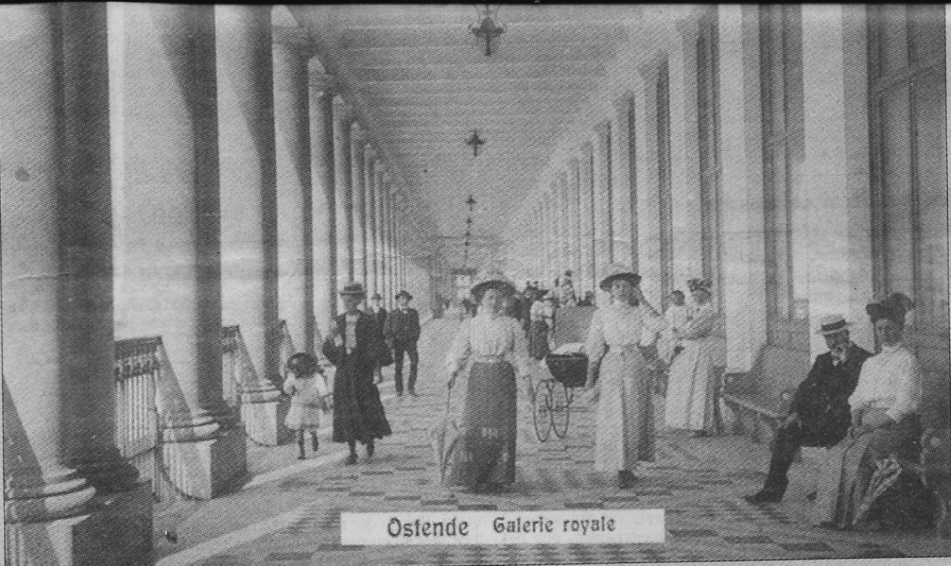
Ostende Galerie royale

Zitbanken en hekkens in de Koninklijke Gaanderijen.