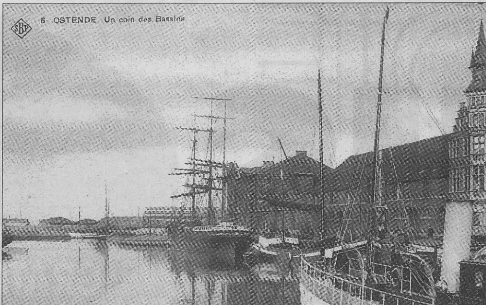
Een beeld van het eerste Handelsdok uit 1906 met op de voorgrond de grote hangars.

Op de eerste foto kan men zeer goed de oude opslagplaatsen opmerken. De meeste van die gebouwen werden nog voor Wereldoorlog II afgebroken. Het gebouw waar het politiebureau van het Hazegras was in ondergebracht, te herkennen als het complex met zijn sierlijke toren, heeft wel tot in 1955 de tand des tijds doorstaan. Toen ook dat gebouw met de grond werd gelijk gemaakt had het precies