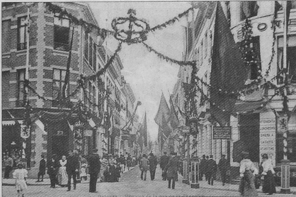
De compleet bevlagde Kapellestraat ter gelegenheid van de zeewijding omstreekt 1908. 't Was schoon om zien.

Het valt vooral op dat de meeste prentkaarten gemaakt werden in 'het seizoen'. Zo bemerkt men dat er vooral rond de eeuwwisseling in Oostende veel werd gedaan om huizen, straten, pleinen en zelfs de schepen bij allerlei gelegenheden extra te bevlagen. Zo was het tijdens de zeewijding in de Kapelle- en Vlaanderenstraat één vlaggenzee. De vaandels wapperden ook aan de staketels en op de schepen met Oostende als thuishaven.