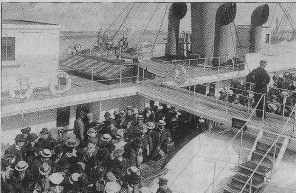
In 1908 was er een drukte van jewelste bij de aankomst van de „Leopold II”.

Kinderen die iedere dag van de vakantie op het strand speelden, wisten dat hun ouders rond 16 u. zouden roepen: „Spoed je, want de male is daar en laat ons in zee baden