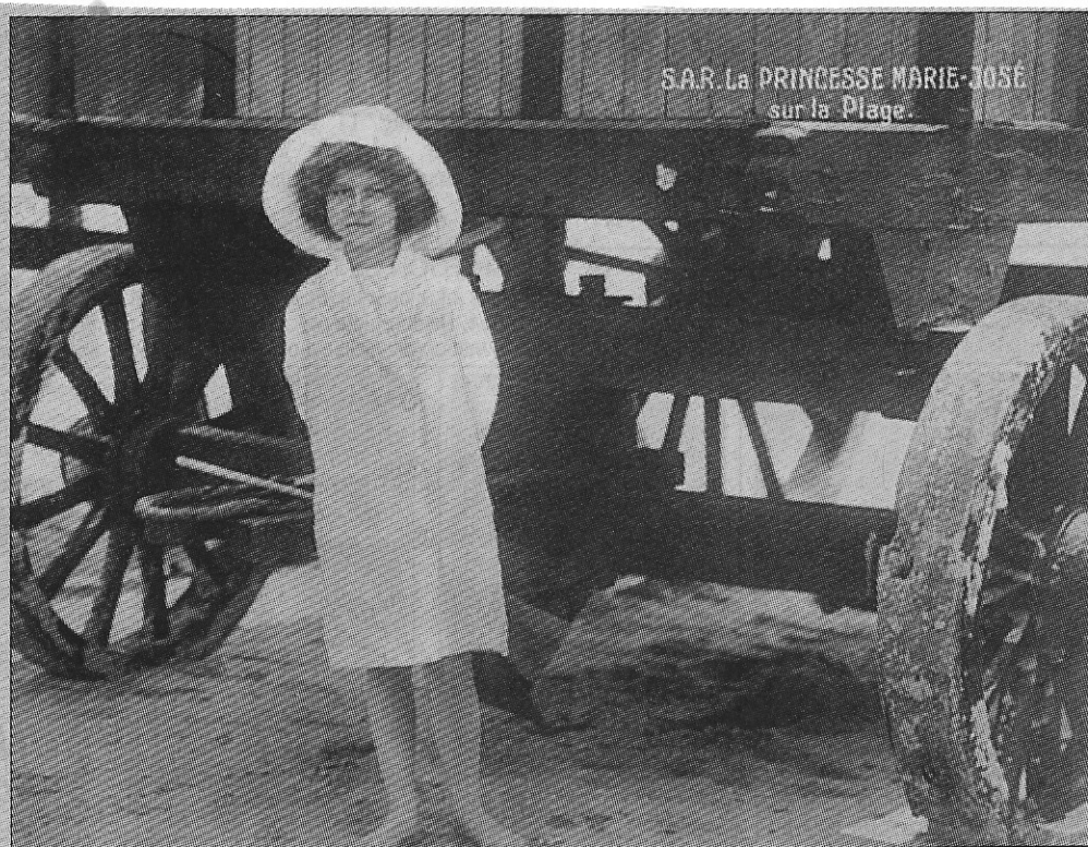
Prinses Marie-José op het Oostendse strand gefotografeerd voor een badkar.