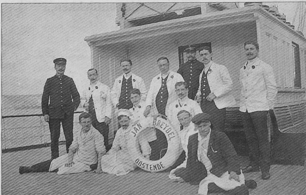
Enkele Wagons-Litspersoneelsleden op de maalboot «Jan Breydel» die voer tussen 1909 en 1931.