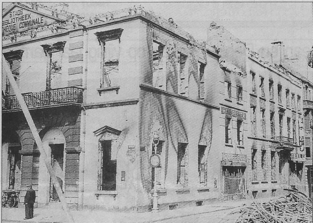
De afgebrande stadsbibliotheek op het Wapenplein in mei 1940 (hoek Louizastraat).

De eerste bibliothecaris was August Janssens, die deze trekking als bijambt kreeg, want in de zomer was hij inspecteur van de baden op het strand. Hij mocht in het begin beschikken over een paar 1000 boeken (in 1863 al 4000) die in een stadhuiskamer op de derde verdieping werden ondergebracht. Om boeken te ontlenen moest men de toelating krijgen van het schepencollege.