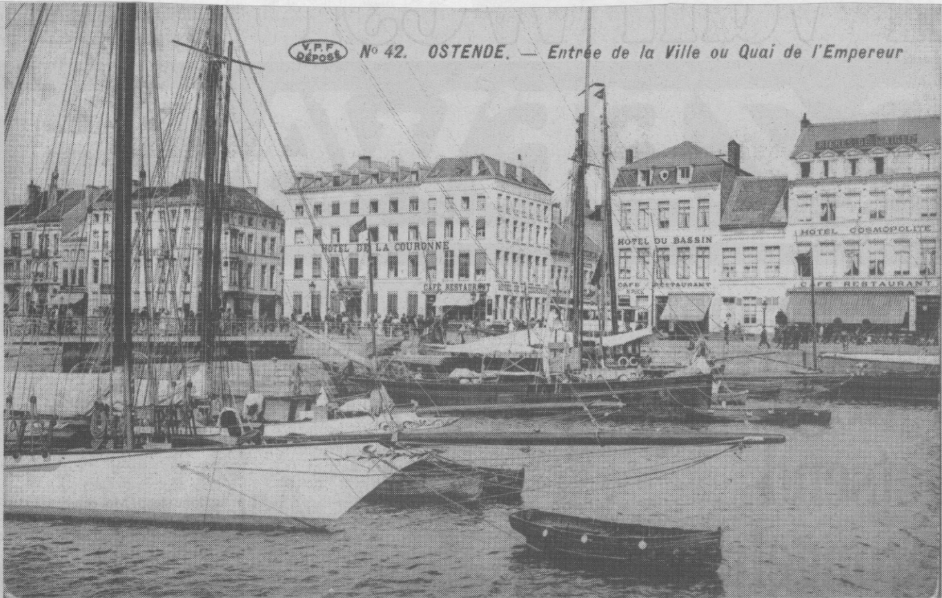
Het Hôtel Cosmopolite rechts op de foto (circa 1912)

N° 42. OSTENDE. — Entrée de la Ville ou Quai de l'Empereur