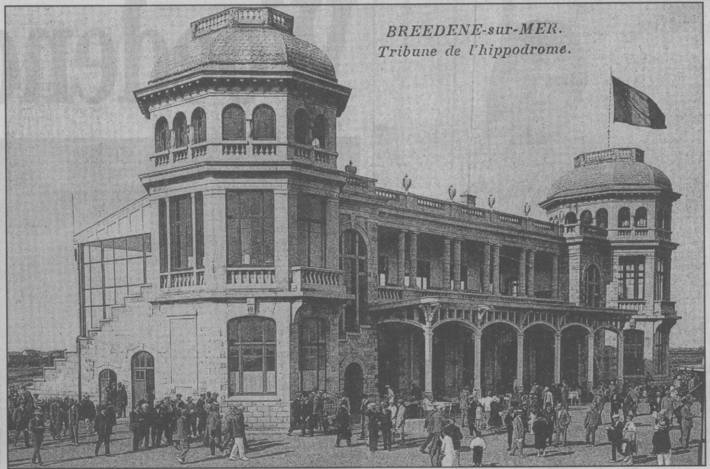
De ingang van de Hippodroom van Bredene met het majestueuse gebouw (ca 1925).

Verleden week hadden we het over de hippodroom Wellington van Oostende. Toevallig kreeg ik deze week enkele oude abonnementskaarten van de hippodroom van Bredene in handen, waardoor ik dacht ook eens die tweede hippodroom uit de vergethoek te halen.