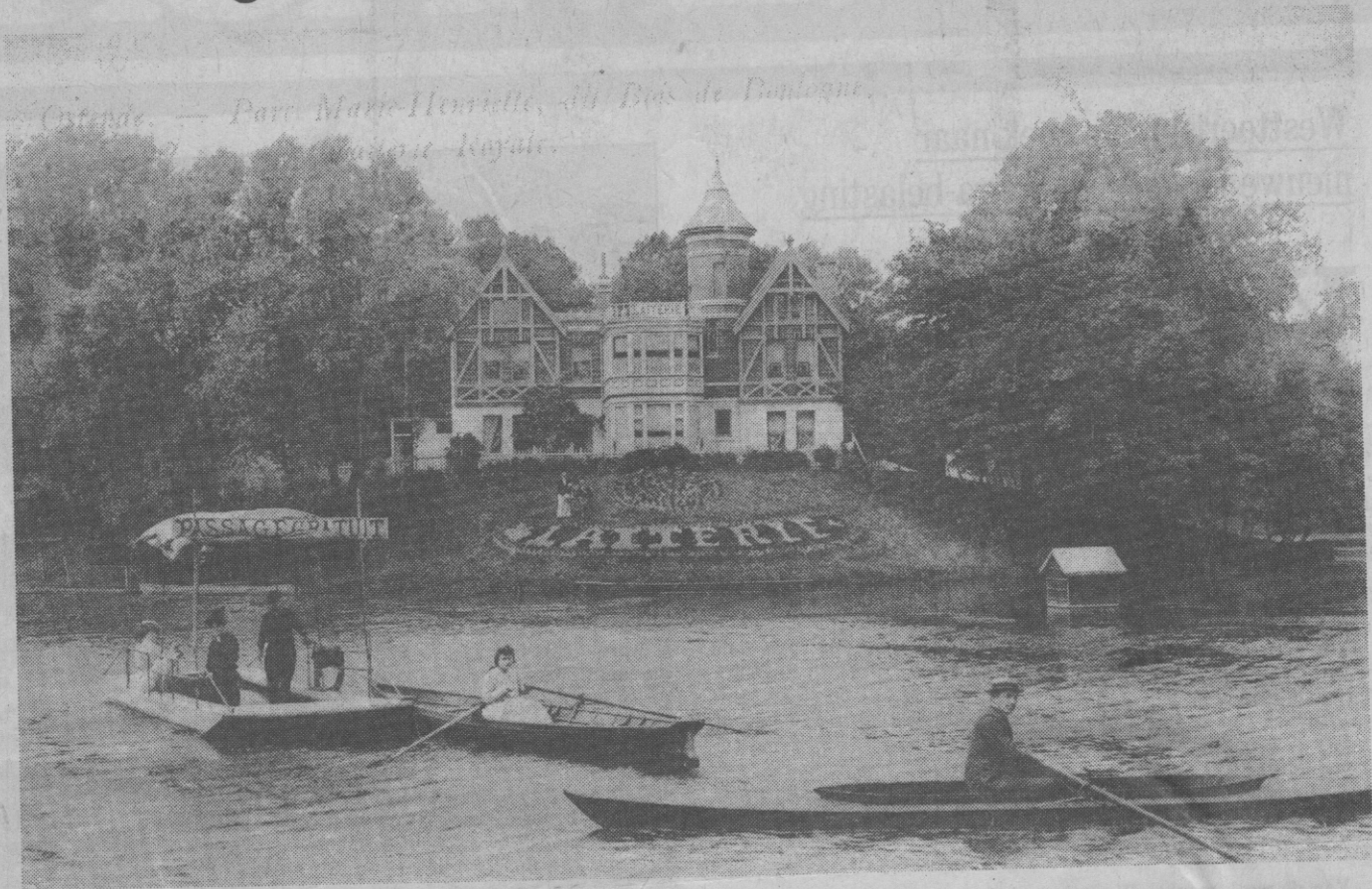
Het oude Laiterietje met prachtige bloemenversiering en een georneerd overzetbootje.

Het was in 1890 dat het stadsbestuur van Oostende de concessie kenbaar maakte voor een consumptiegebouw dat op het eilandje in het Maria-Hendrikapark opgetrokken was, te exploiteren. Deze concessie werd tegen het midden van 1890 toegewezen. Dus juist 100 jaar geleden!