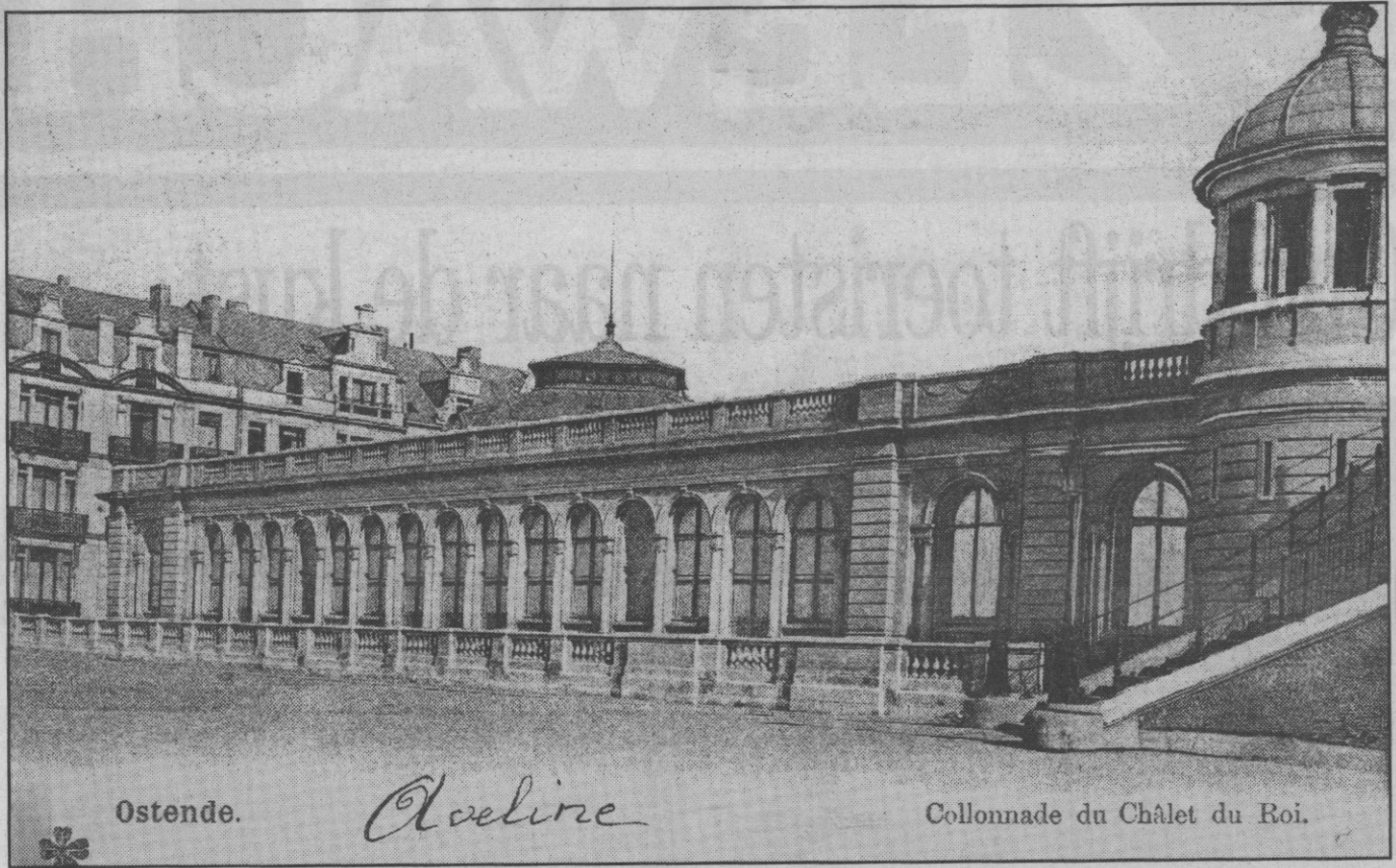
De Venetiaanse Galerijen, kant Albert I-Promenade, richting Parijsstraat. (1902)