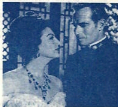
Majoor Matt Lewis (Charlton Heston) begeleidt Baroness Natalia Ivanoff (Ava Gardner) naar een bal op het Brits ge- zantschap.