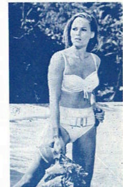
JAMES BOND 007 CONTRE D' NO