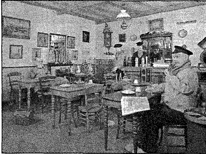
Enkele oude karren samengebracht : de viskar, de scharlijperskar en de roomijswagen.