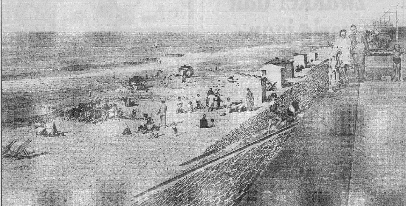
De trap nabij Raversijde. (Circa 1950)

Iedere Oostendenaar die van in zijn jeugd naar het strand ging, weet de fameuze ijzeren leuningen zijn met de blauwstenen trappen die naar dit strand leiden. Die trappen speelden een grote rol in wat we hier ook kustfolklore zouden kunnen noemen.