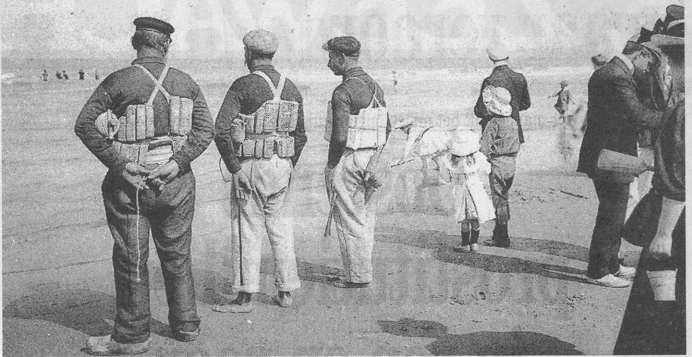
Enkele redders staan op klompen met alle kleren aan (want zo gingen ze ook het water in) langs de waterkant de baders gade te slaan (circa 1900).