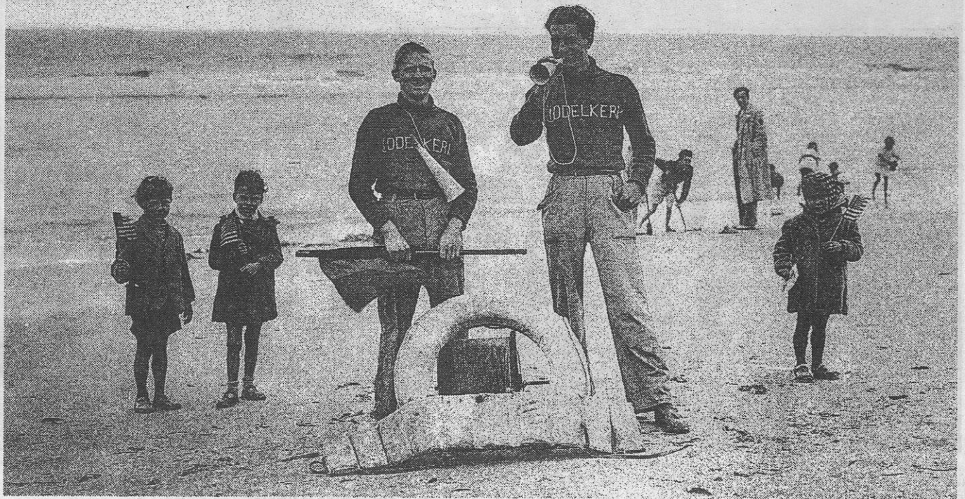
Twee redders in Raversijde. De afzender van de prentkaart schrijft op de keerzijde : "Gij hebt gelezen in de kranten van zondag over het ongeluk van Raversijde. Het is de redder van rechts die verdronken is en het zijn twee gezellen van onze groep die onvoorzichtig zijn geweest". En verder : "We hebben een grote omhaling gedaan voor de familie van de verdronken redder, die de oudste was van vijf kinderen". (kaart verstuurd in augustus 1949). Ook op prentkaarten kan men menselijke drama's lezen.