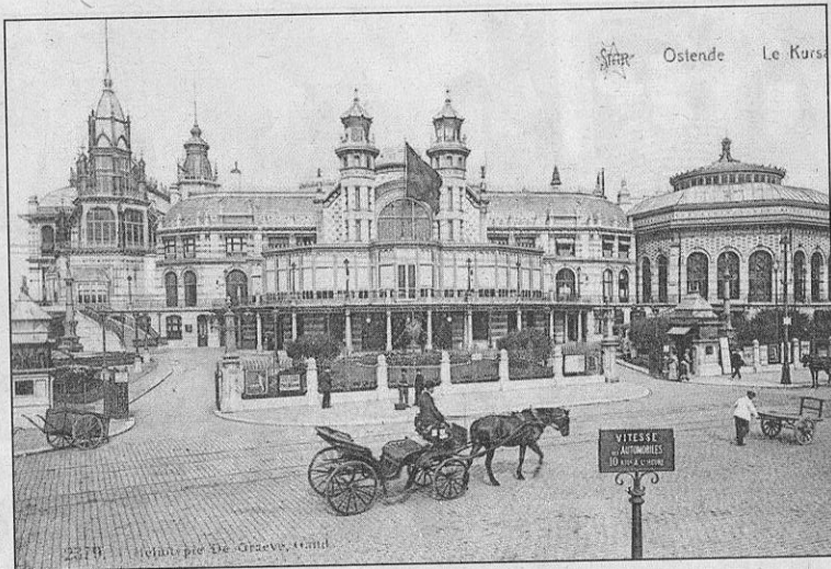
De Kursaal rond 1910

■ OOSTENDE – We denken graag aan het Oostende van vroeger. Al meer dan een eeuw geleden wist de stad hoe ze toeristen moest lokken.