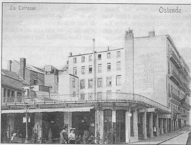
'La Terrasse', een etablissement dicht bij de zeedijk en het stadscentrum in de jaren '20.