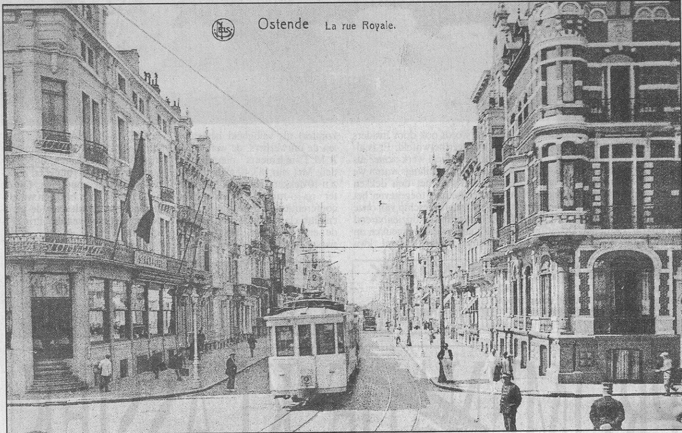
De Koningstraat, gezien van aan de hoek van de Leopold II-laan. Links ziet men het Savoy-Hotel.