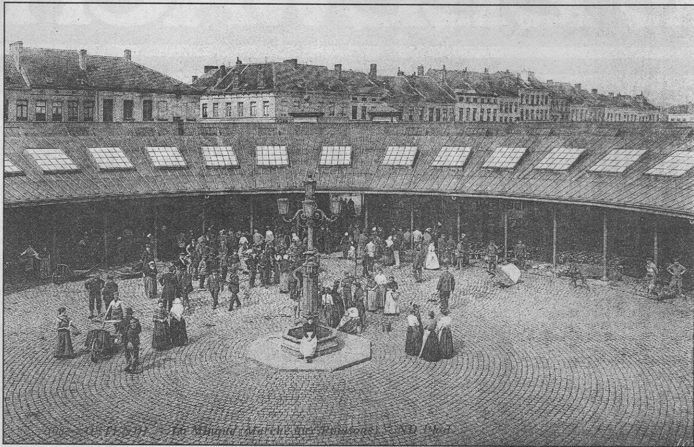
"De Cierk" met de Visserskaai in de achtergrond (circa 1900)