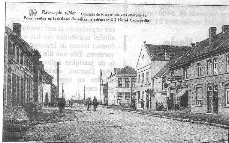
Oud-Raversijde langs de Nieuwpoortse Steenweg

Wat verder had men voor de Eerste Wereldoorlog het befaamde Stracké-museum. Het werd vernield als gevolg van de oorlog. Langs de zeedijk werden een paar grote hotels gebouwd, zoals het hotel Concordia en het hotel Royal Midland. Voor vele Oostendenaars was Raversijde dan ook een mooie bestemming voor een wandeling.