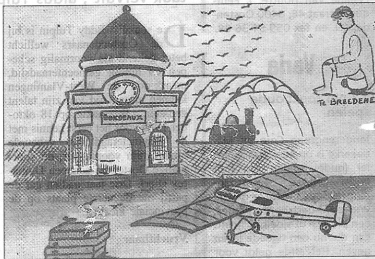
Het vliegtuig voor de Bordeauxvluchten

De tweede kaart toont een poort met een uurwerk en de naam Bordeaux, de Franse stad die bij duivenmelkers heel bekend is. Men ziet heel wat losgelaten duiven die