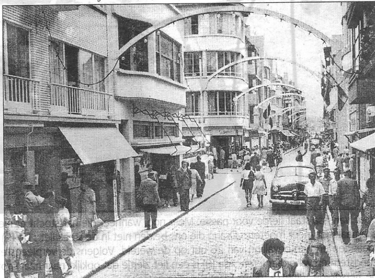
De Vlaanderenstraat richting Zeedijk, toen wandelen in het midden van de straat nog heel gewoon was.

Op de ene kaart ziet men de Vlaanderenstraat, waar meer mensen zich in het midden van de straat dan op het trottoir bevinden. De andere kaart toont de Kapellestraat in de jaren zestig, met zeer smalle voetpaden. Uiteindelijk heeft men later van de Kapellestraat een verkeersvrije winkelwandelstraat gemaakt en de voetpaden afgeschaft.