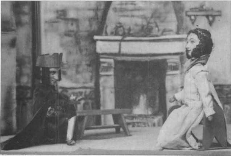
Binnenhuisscene uit ASSEPOESTER Links: De Prins, Rechts: Assepoester