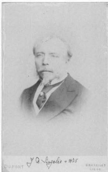
JEAN-BAPTISTE SINGELEE (ANNO 1875) (FOTO DUPONT, BRUSSEL)