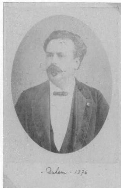
DUHEM (ANNO 1876)