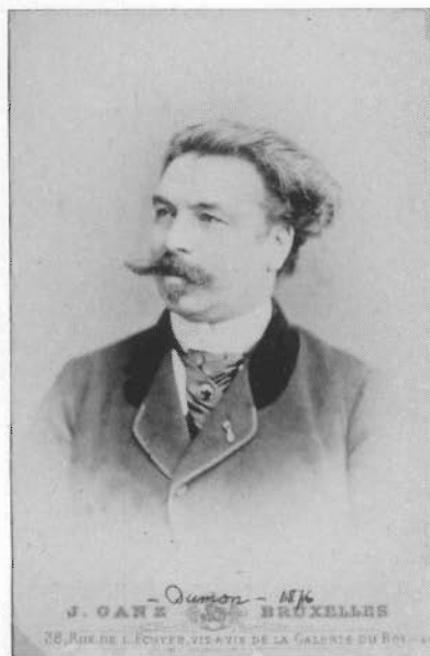
J. DUMON (ANNO 1876)