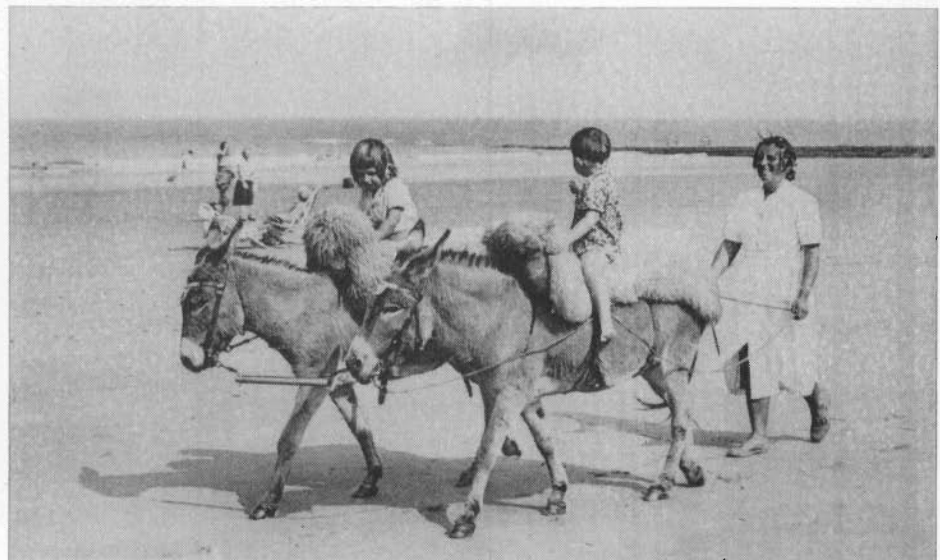
De ezeltjes zetten een honderdjarige traditie verder langs 't hard zand (1950)