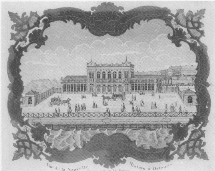
Het eerste station van Oostende (litho-kaart ± 1845) - gebouwd in 1838.

Een zijzicht van het station van 1882, afgebroken in 1956. Men ziet het eerste station van 1838 er in verwerkt. Na de 2de W.O. was de Handelskamer in die vleugel gevestigd.