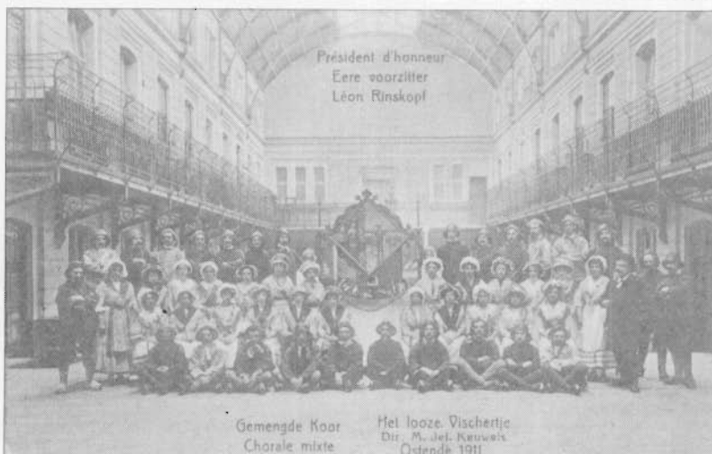
Het looze vissertje in de Leopoldschool