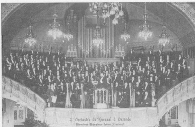
Het grote kursaalorkest (1904)