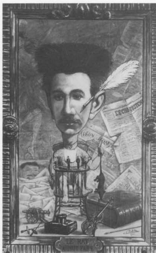
"Le Rat à tout faire" Karikaturaal portret van Georges Daveluy door Emile Bulcke (1901)