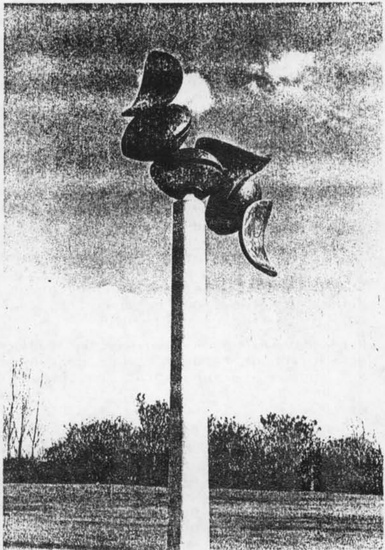
Levensboom, 6,5 m

Zijn vroegste beelden waren ietwat mysterieuze, meubelachtige constructies. Spirit, speelsheid en humor waren er de kenmerken van. Zo vertoonden ze laatjes, bakjes, hokjes en kastjes om iets zorgvuldig op te bergen, doch de deurtjes bleken alleen in de verkeerde richting te kunnen draaien. De bergruimten zelf waren leeg of er lagen