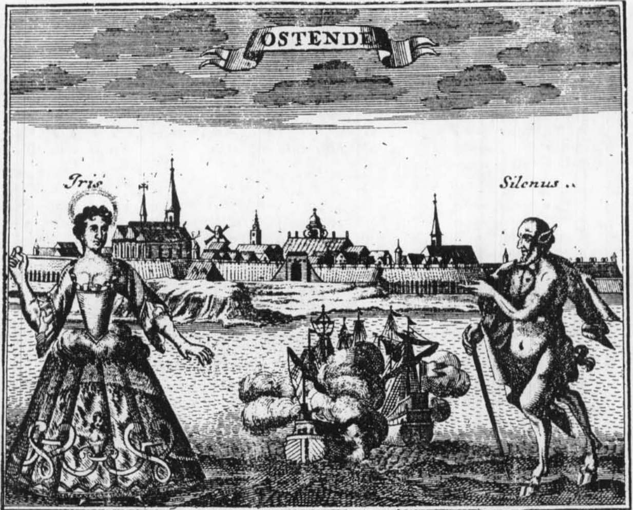
Oostende uit het Noorden uit "Die Reisende Chinesen", Leipzig, 1726 Anoniem naar een prototype van Joh. PEETERS