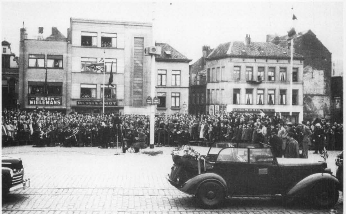
Uitvoering van een gelegheidsconcert op het Vissersplein. Let ook op de verdwenen huizenblok tussen Bonenstraat en Cadzandstraat !