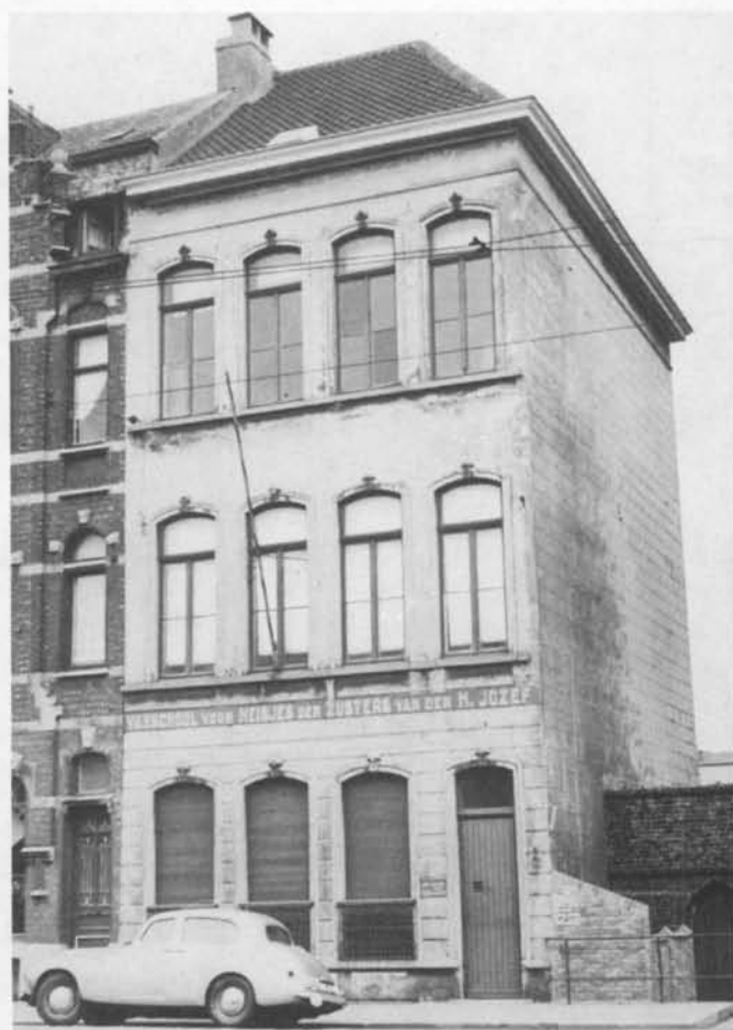
GRAAF DE SMET DE NAEYERLAAN anno 1952