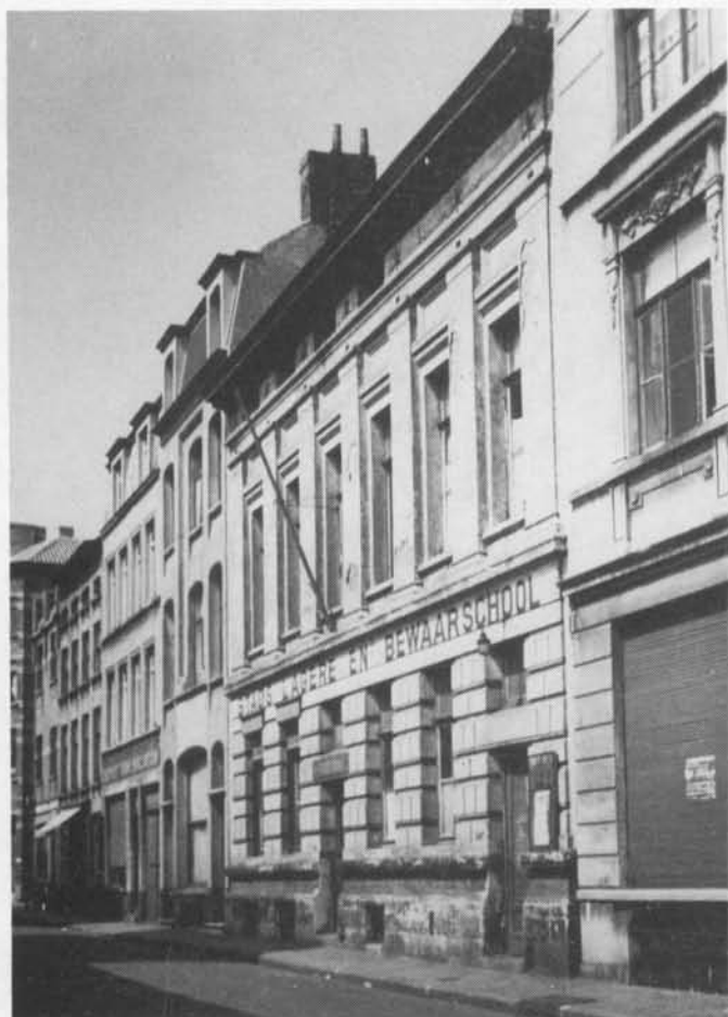
SINT FRANCISCUSSTRAAT anno 1952