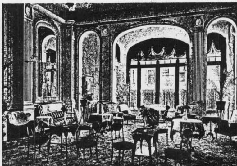
Hotel Splendid, Ostende