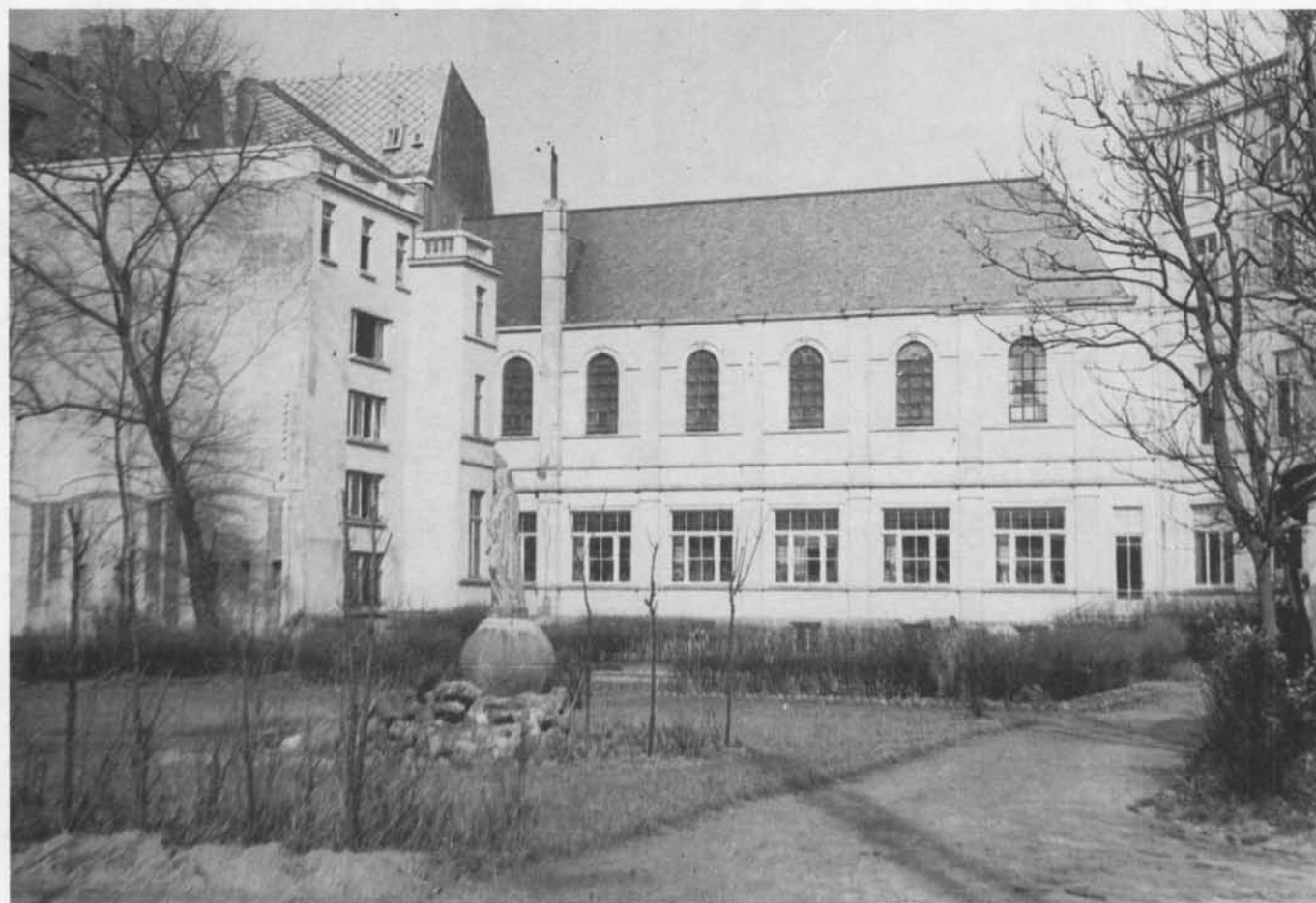
DE "SACRÉ-CŒUR" - ZEEDIJK anno 1954