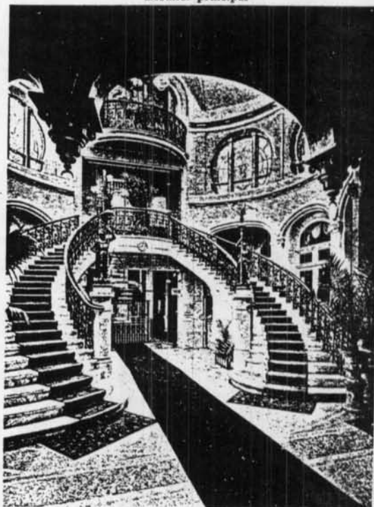
Hotel Splendid, Ostende