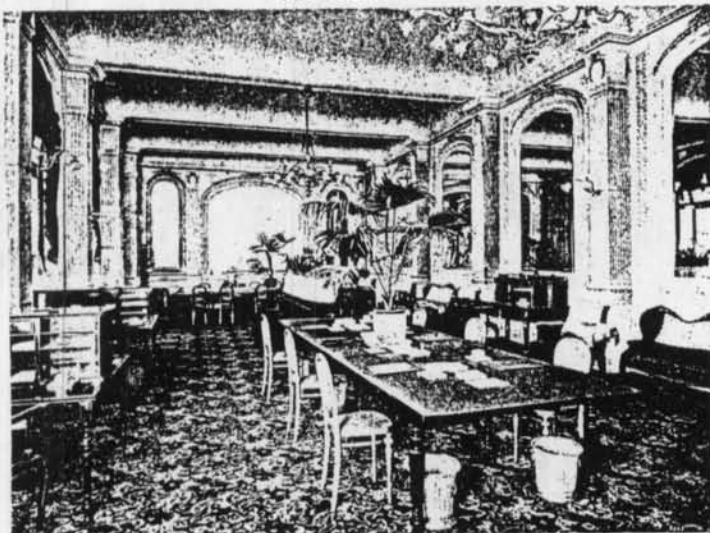
Hotel Splendid, Ostende

Oostenrijker, Tsjech of Hongaar op. De keuken is nog overwegend Frans. Tot 1929 is de maitre d'hôtel een Italiaan maar van 1930 af kan dat ook een Belg zijn. En gestaag groeit het inheems personeel. In 1922 is dat 73 %, in 1938 84 %.