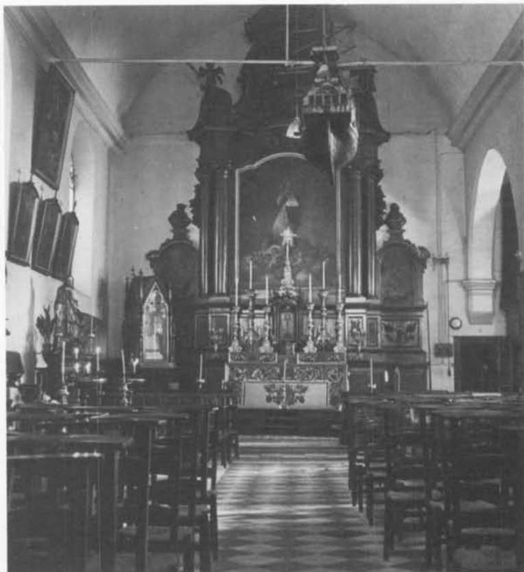
O.L. Vrouw-Altair (1950)