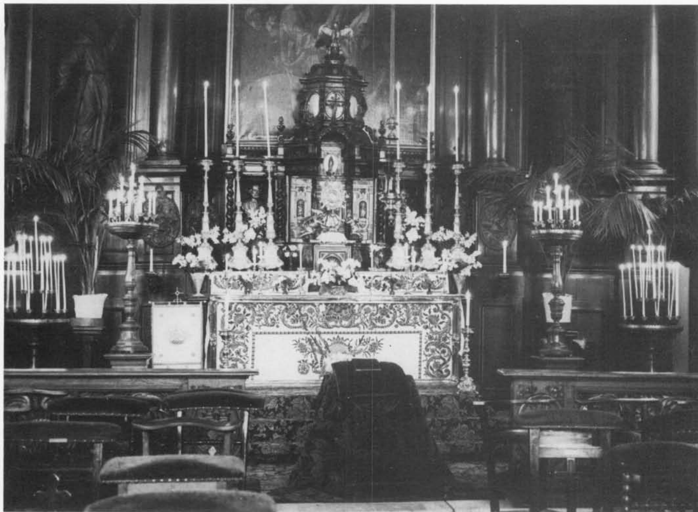
Het barokke hoofdaltaar met dito versiering in de preconciiliaire tijd