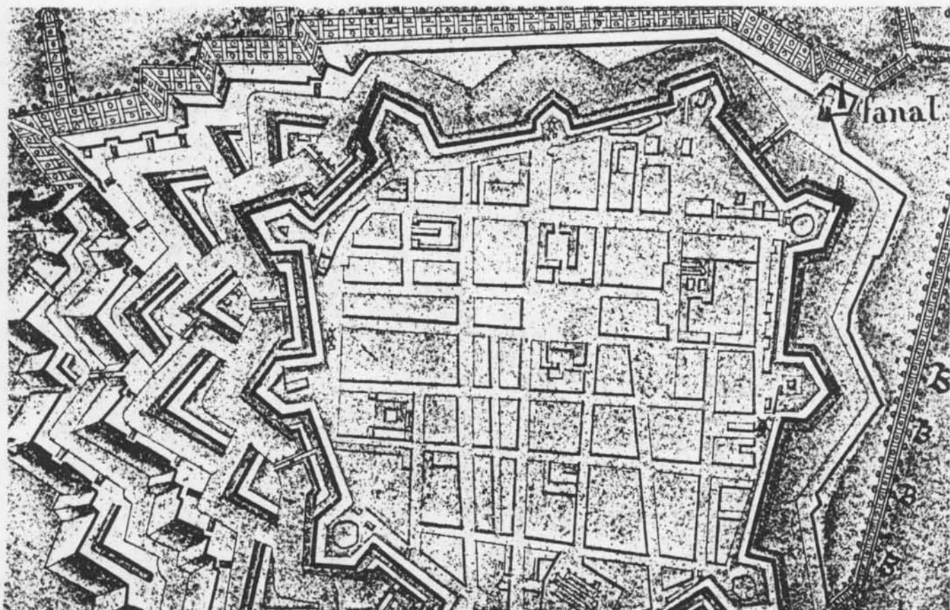
detail uit GYSELINCK's "Plan de la ville d'Ostende et du Fort Philippe" (échelle de 400 toises), 1778. (Vergroting 1,55). Oostende, Stadsarchief

Het enige wat de tijd nog overlaat van het klooster en van de kerk die door de mendicanten zijn gesticht, uitgebreid en met zorg onderhouden, nagenoeg gedurende twee eeuwen, is de bidplaats. Het typische is in dit gebouw bewaard gebleven en het is zeker nog een bezoek waard.