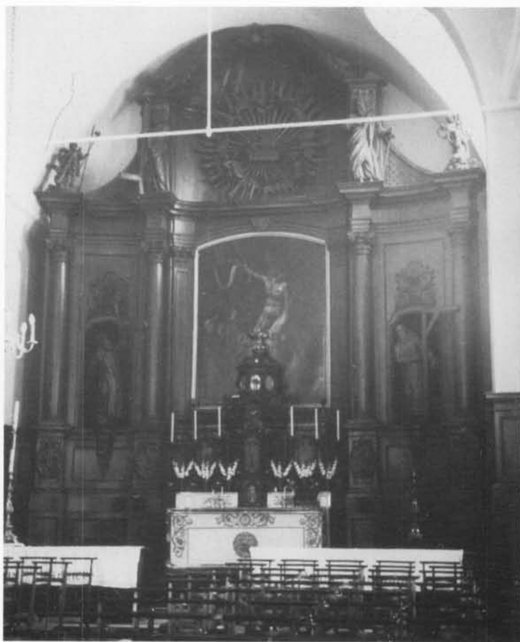
Algemeen beeld van het hoofdaltaar kort na de restauratie. (dia J.P. Falise)