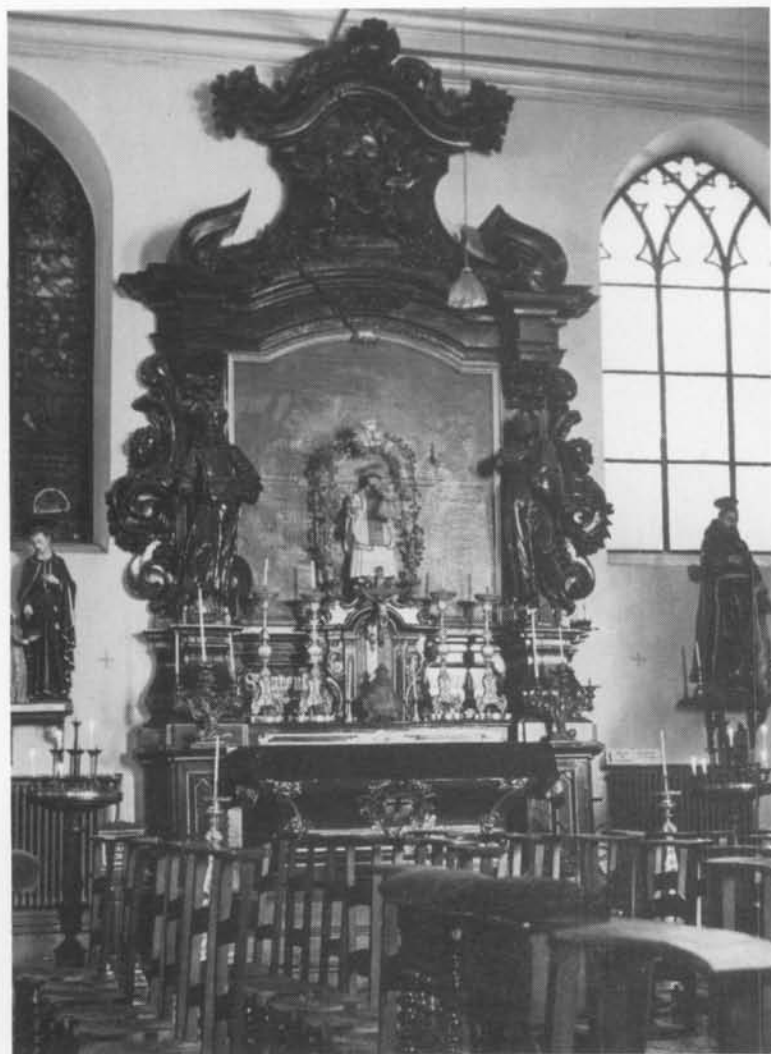
Altair gewijd aan ST.-Antonius Van Padoua (1950)