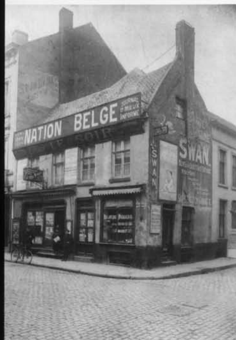
Hoe het begon