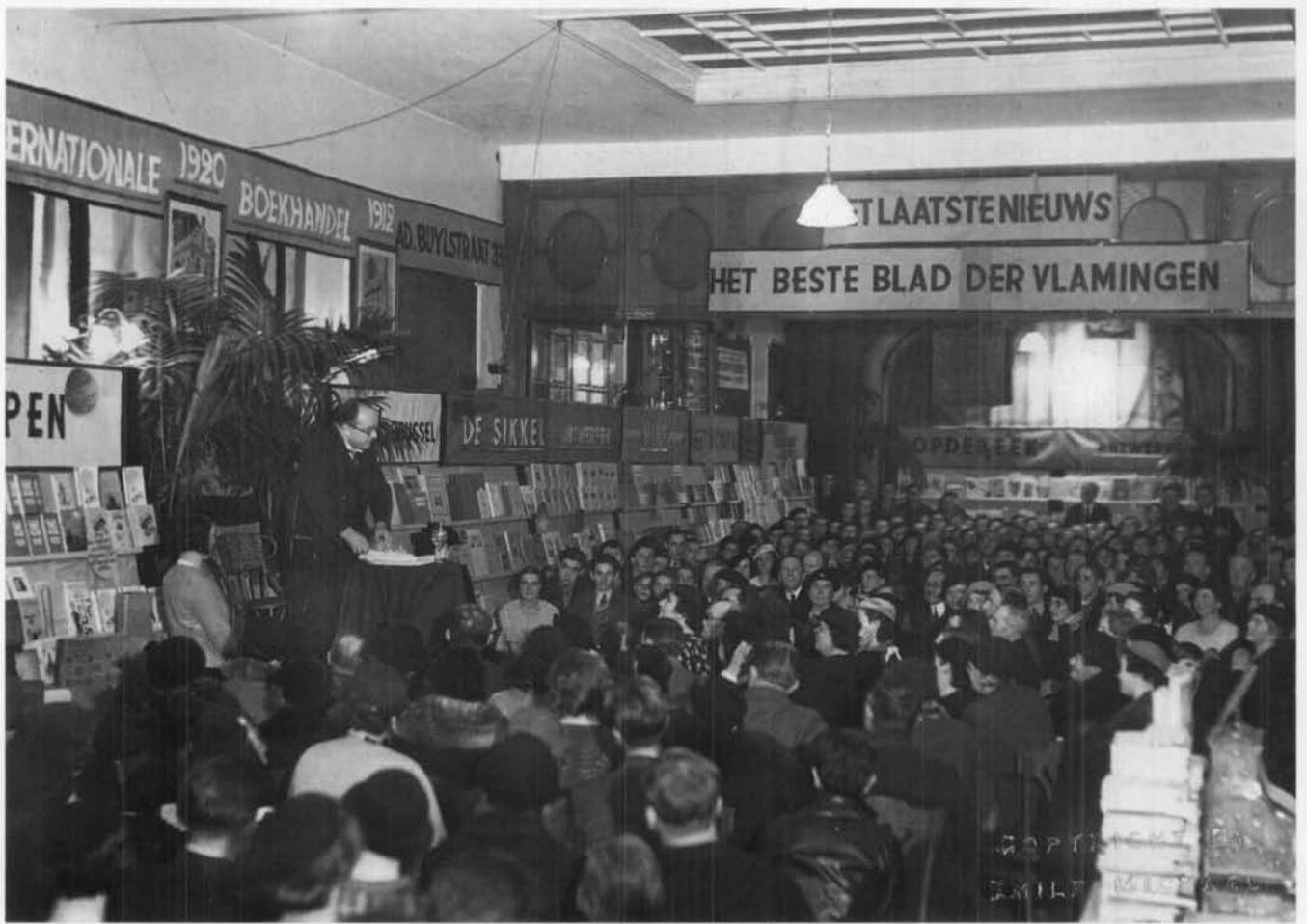
Boekenweek in November 1935