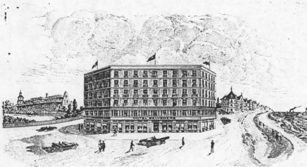
Hotel Belvédère Ostende