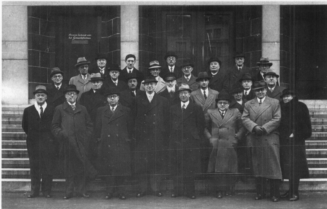
Als lid van de gemeenteraad op 19 mei 1940