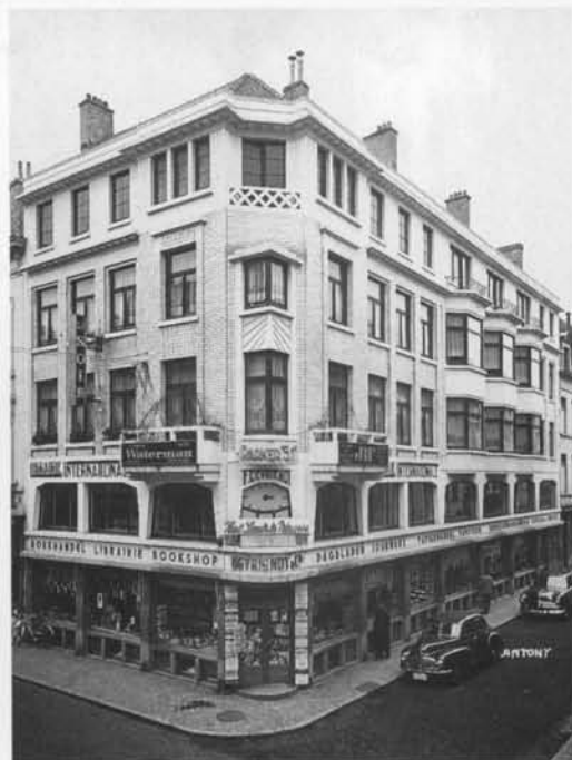
En wat het uiteindelijk werd