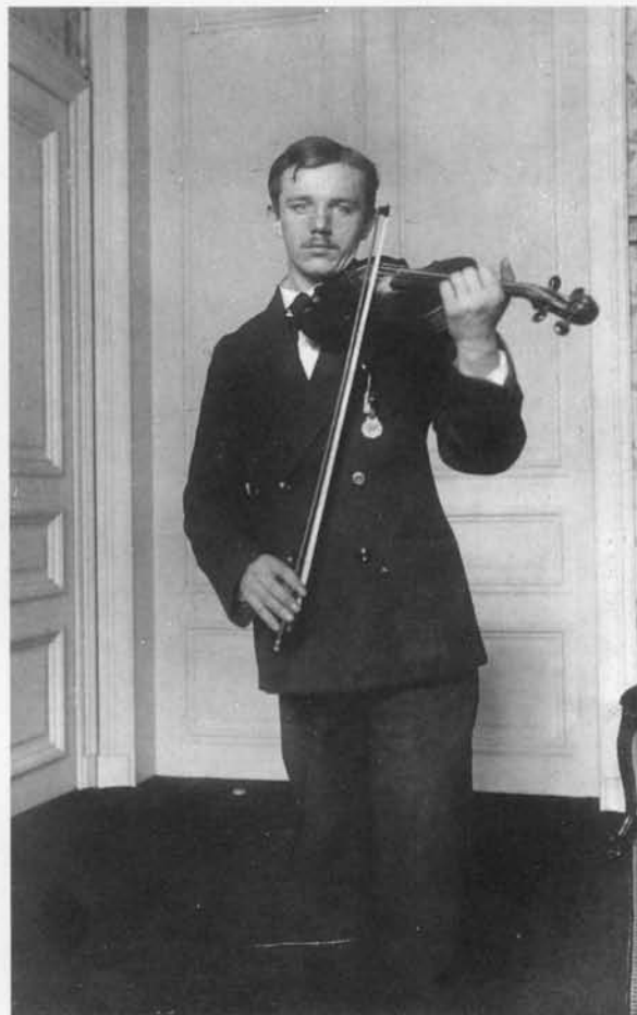
... en als muzikant