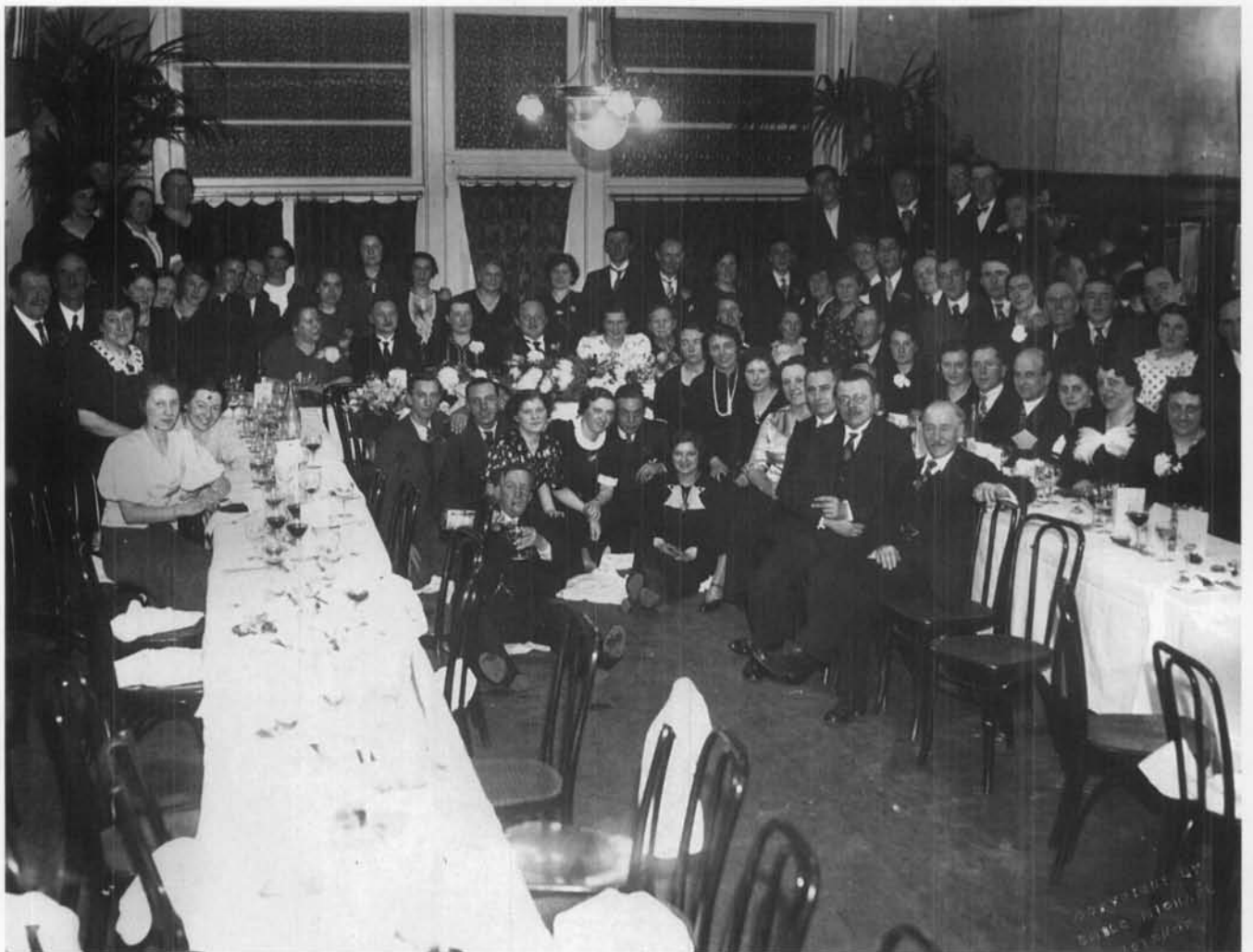
Personeelsfeest in 1937