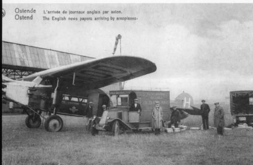
Ostende Ostend L'arrivée de journaux anglais par avion. The English news papers arriving by aeroplanes.