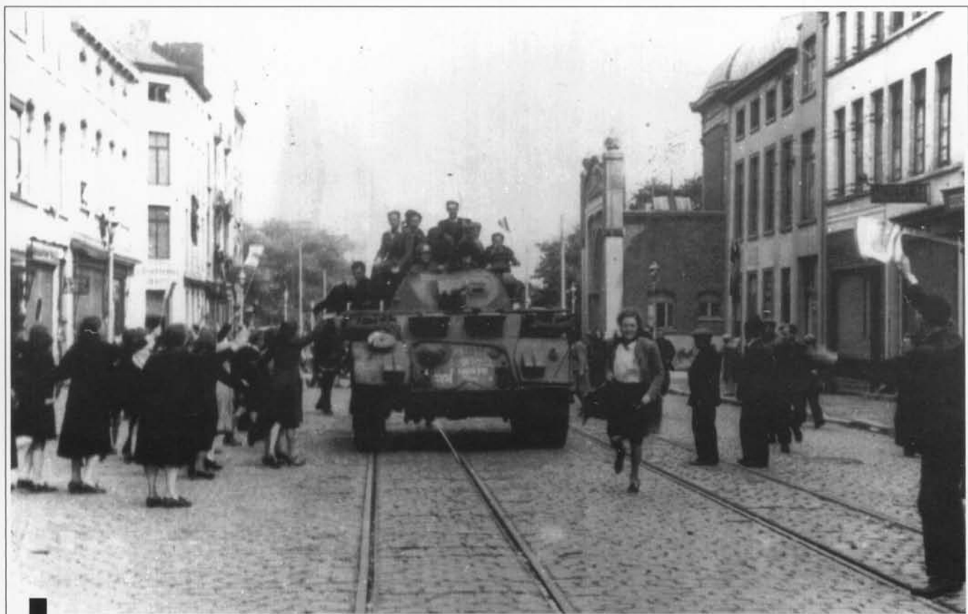
OP DE ALFONS PIETERSLAAN