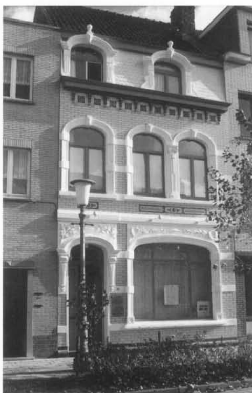
Het geslaagde resultaat.