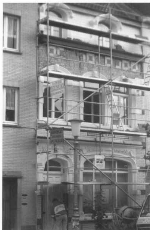
De restauratie in volle gang.