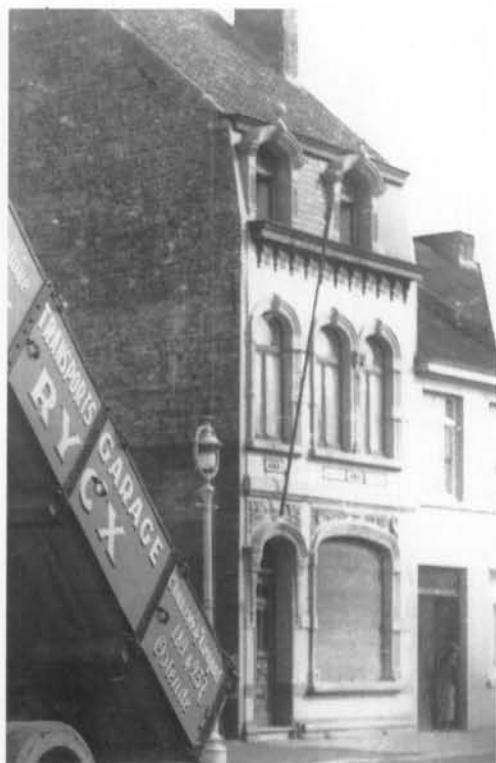
Het huis in 1923.