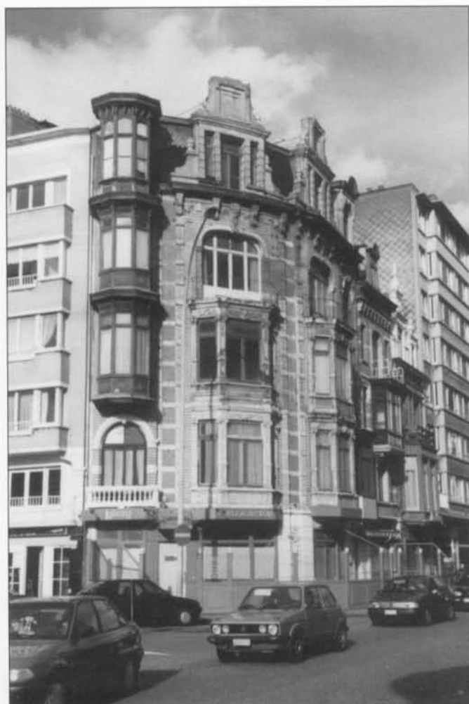
Voor de restauratie