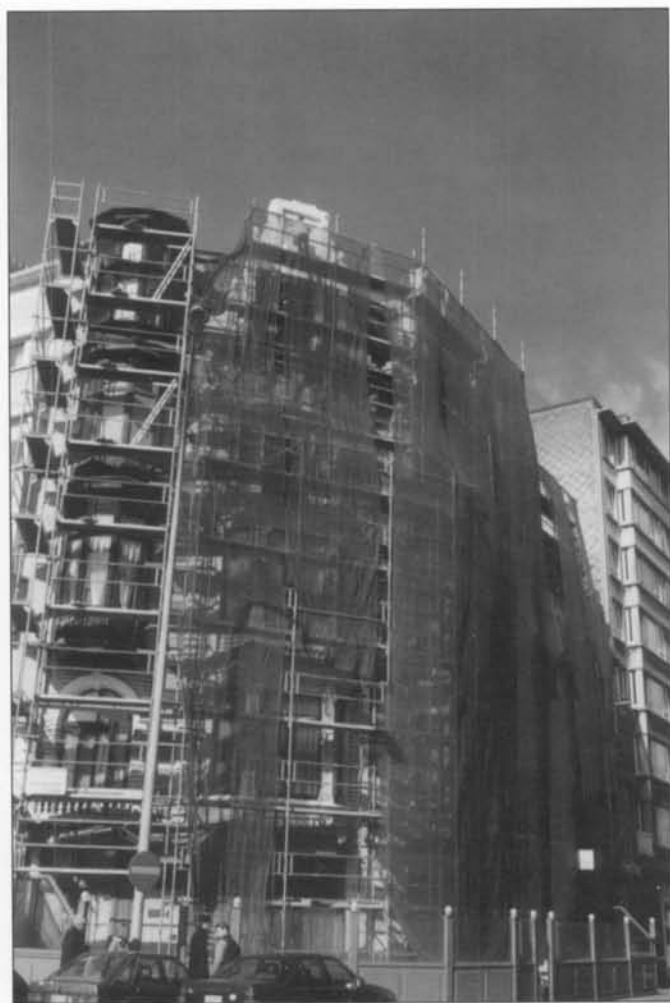
De stelling staat er.