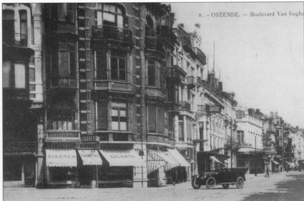
In de goede oude tijd.