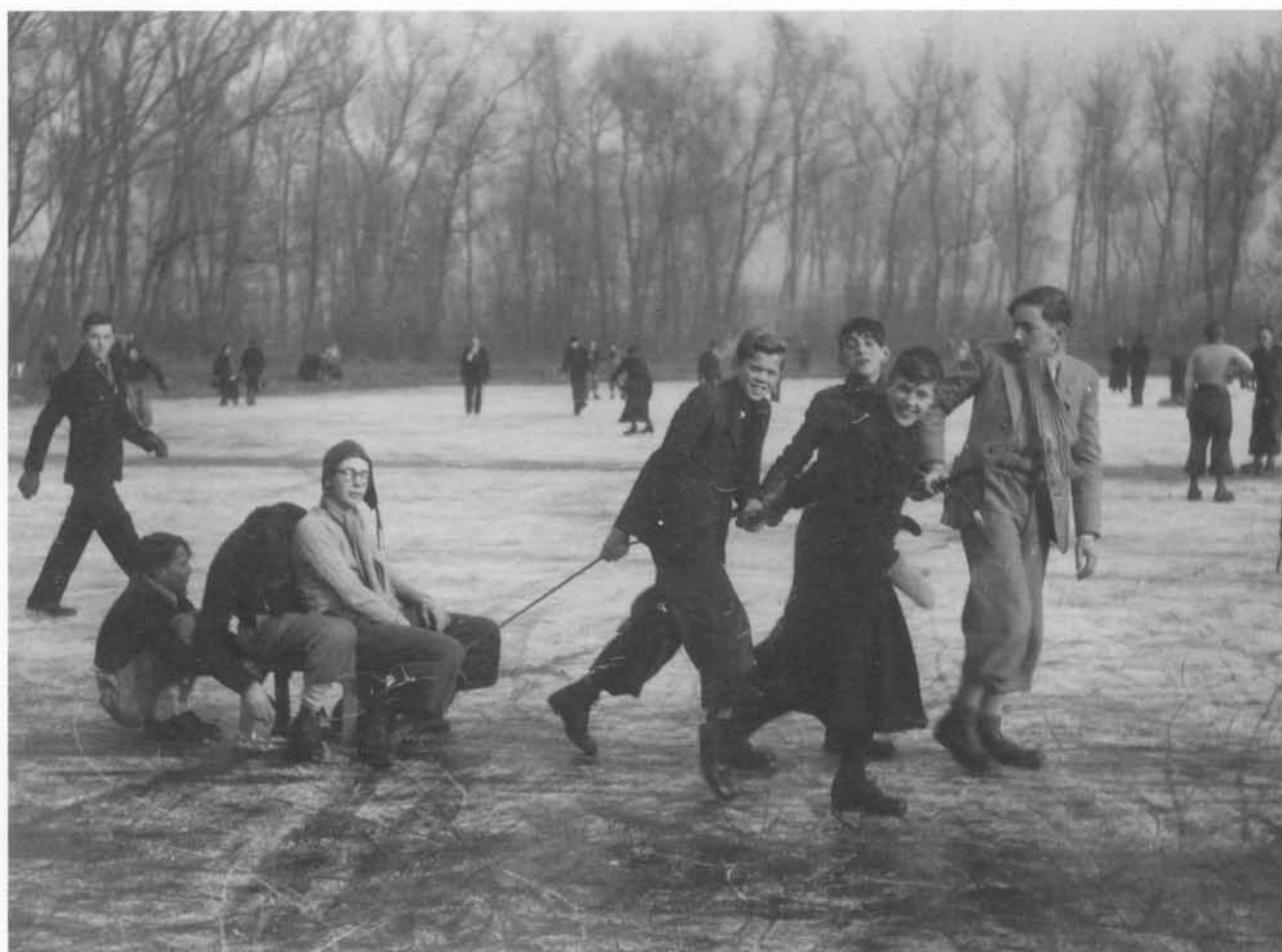
Winterpret in het Maria - Hendrikapark