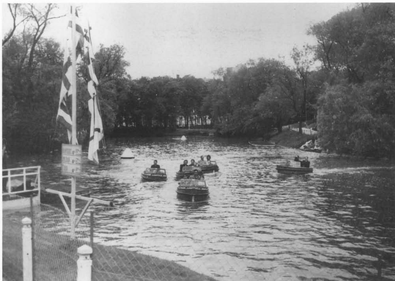
Zomerpret in het Leopoldpark