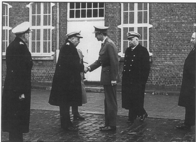
De Koning begroet door de autoriteiten van de Marine