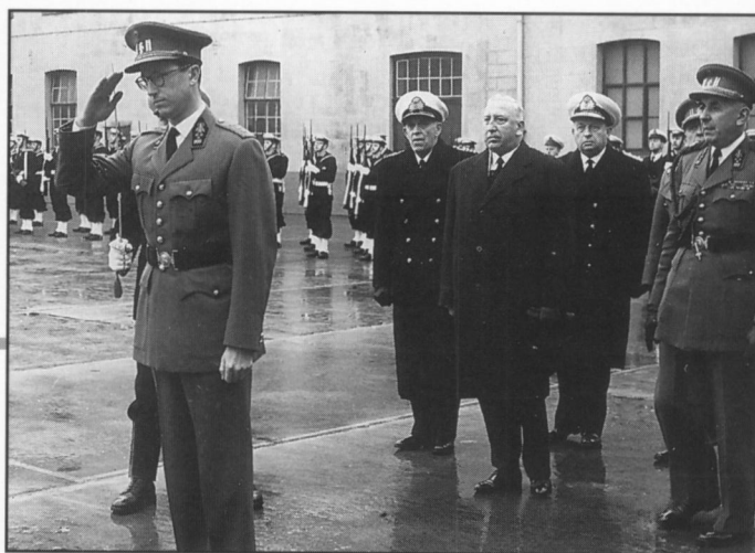
De Koning schouwt de troepen