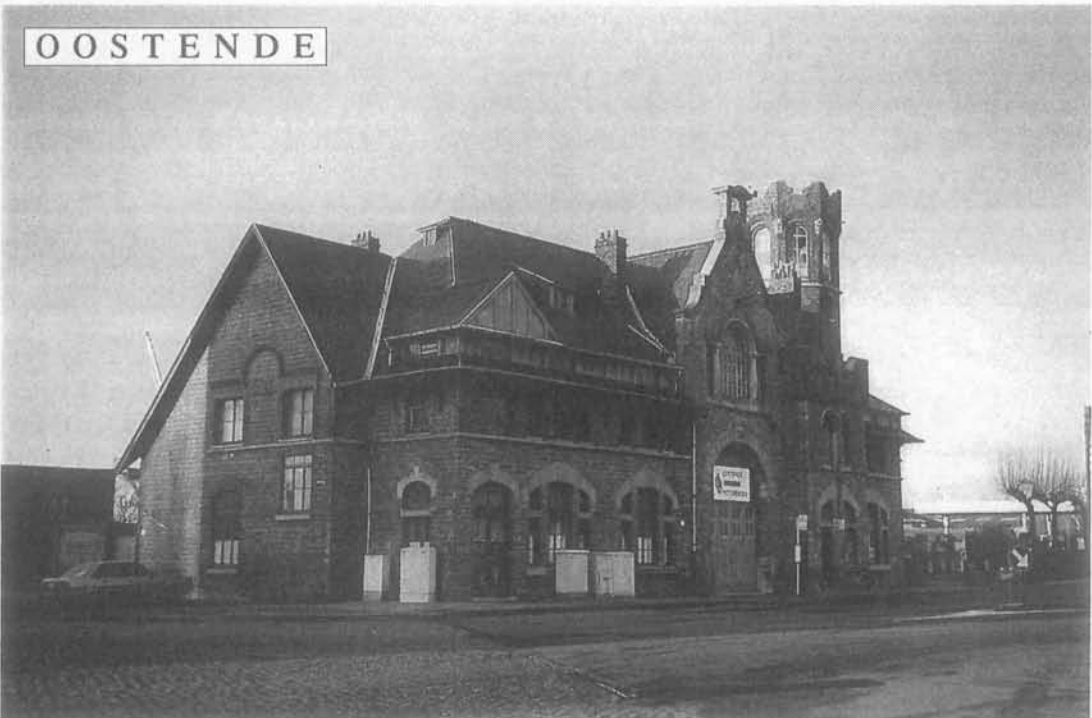
DE OUDE BRANDWEERKAZERNE