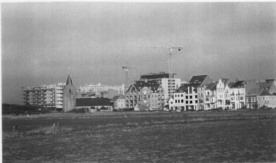
Foto 1 = Dit beeld heeft duidelijk aan hoe "ruimtelijke ordening" niet moet. Deze omgeving is het product van het naoorlogse en hedendaagse stedenbouwkundig beleid. Soms zou je kunnen denken dat de Oostendenaar een aangeboren allergie heeft voor wat schoonheid wel kan zijn. Het eeuwenoude Duinenkerkje vergaat in het oprukkend miskleunend bouwsel waaraan geen einde komt; bemerk de dreigende bouwkranen.