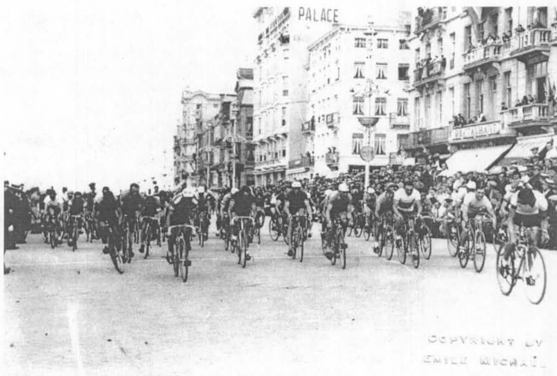
Vertrek van de 53 renners op de Zeedijk. Bemerkt de grote volkstoeloop