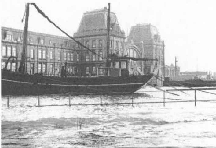
In de sluis tussen Montgomerydok en Mercatordok