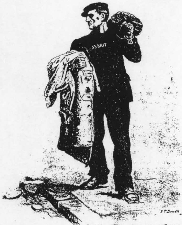
"A Message from our Seamen"

We risk our lives to bring you food It's up to you not to waste it